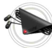
ThinkPad® X1 In-Ohr-Kopfhörer

Exzellente Soundqualität und hoher Tragekomfort