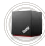
ThinkPad® WiGig Dock

Exzellente Soundqualität und hoher Tragekomfort