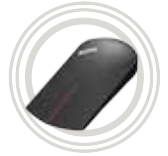
ThinkPad® X1 Wireless-Touch-Maus

Drahtlos verbinden und neue Funktionen mit Ihrem Gerät nutzen